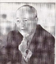
Dominique Schmitt.

La présentation de ces projets de redécoupage intervient dans un contexte-charnière : il s'agit, certainement, du dernier acte fort en Gironde d'un préfet, Dominique Schmitt, qui va quitter la préfecture ces jours-ci - il est nommé à la Cour des comptes (notre édition du 7 avril). Il sera remplacé par Patrick Stefanini, actuel préfet de la région Auvergne. La question que se posent les élus est donc : comment le futur préfet abordera-t-il ce dossier ? À suivre.