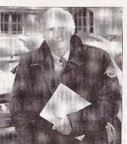
Patrick Stefanini.

La présentation de ces projets de redécoupage intervient dans un contexte-charnière : il s'agit, certainement, du dernier acte fort en Gironde d'un préfet, Dominique Schmitt, qui va quitter la préfecture ces jours-ci - il est nommé à la Cour des comptes (notre édition du 7 avril). Il sera remplacé par Patrick Stefanini, actuel préfet de la région Auvergne. La question que se posent les élus est donc : comment le futur préfet abordera-t-il ce dossier ? À suivre.