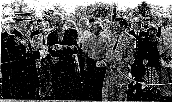
Les autorités reçoivent le traditionnel carillon souvenir du ruban bleu blanc rouge.

avons fait. En effet, en tant que propriétaire, la commune est encore plus proche d'eux et le règlement des petits problèmes inévitables en est ainsi facilité. Nous en avons découvert quelques uns au cours des premières semaines d'utilisation. Tout sera mis en œuvre pour les faire r a p i d e m e n t disparaître.