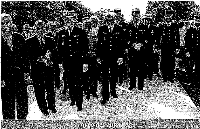
L'arrivée de autorités.

Nous sommes aujourd'hui réunis pour inaugurer les locaux de la brigade de gendarmerie de Saint Jean d'Illac. Ce jour est l'aboutissement d'une longue histoire faite de la détermination des élus et en particulier des maires de notre commune et des communes voisines. Cette réalisation est presque parfaite et son histoire mérite d'être rappelée.